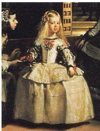
fig.2 - Detalhe da obra de Diego Velázquez